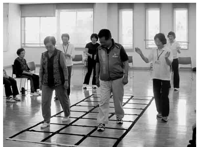
練習を経てニコニコ教室で上手に指導を担当するサポーターさん。

会はサポーター 5 人という少人数ですので、特に代表や会長などは決めていませんが、チームワークよく活動しています。ふまねっと運動の理念である地域の貴重な社会資源として着実に活動を展開しています。また、サポーター自身の健康づくり（介護予防）でもあり、教室参加者のがんばりに励まされることもあるようです。今後は、新たにサポーターになりたいという方が現れてくれるような活動にしていきたいと思っています。