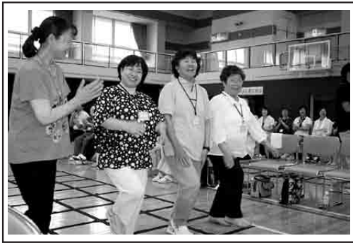
8月24日(金)に比布町(びっぷちょう)で上川管内女性大会が開催され、比布町の20名のサポーターさんのサポートにより、150名もの参加者がにぎやかな雰囲気の中ふまねっと運動を体験しました。

NPO法人地域健康づくり支援会 ワンツースリー 〒001-0023 札幌市北区北23条西6丁目1-45 浜ビル1階 ☎011-747-5007 ☎011-747-5008 ✉info@1to3.jp